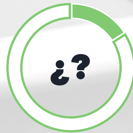
Aún no sabe