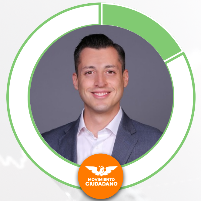
Luis Donaldo Colosio