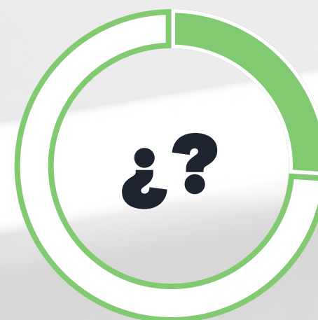
Aún no sabe