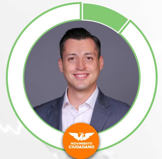
Luis Donald Colosio Riojas