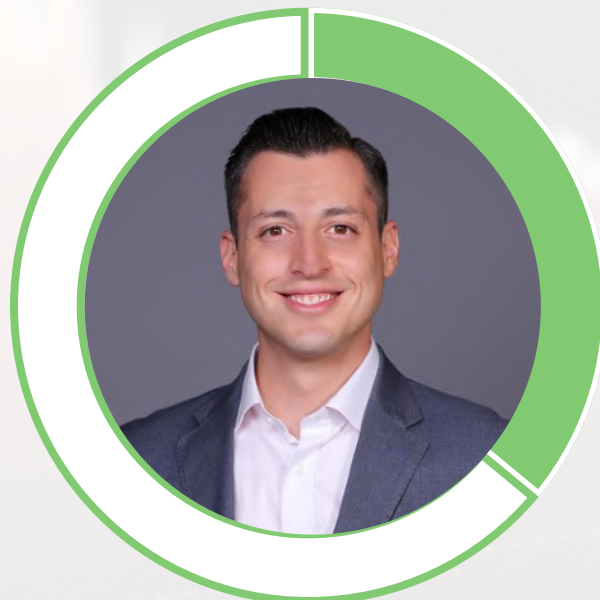
Luis Donaldo Colosio