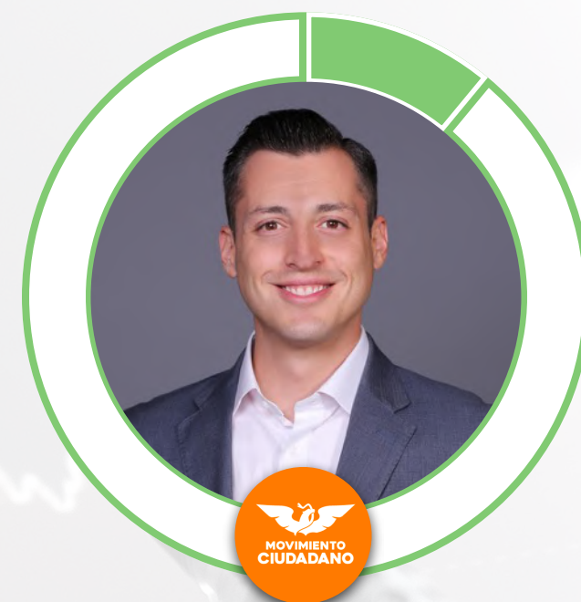
Luis Donald Colosio Riojas