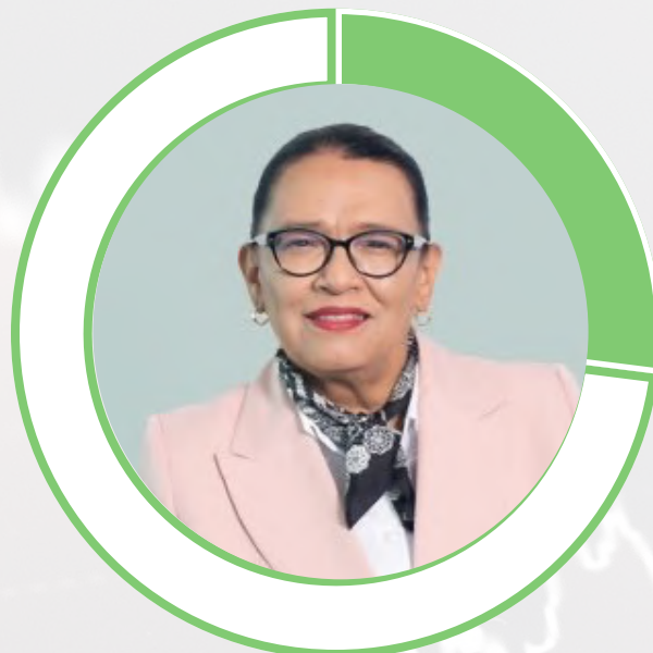
Rosa Icela Rodríguez Velázquez