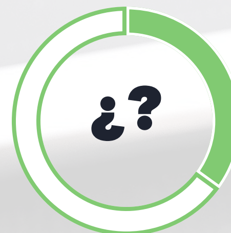
Aún no sabe