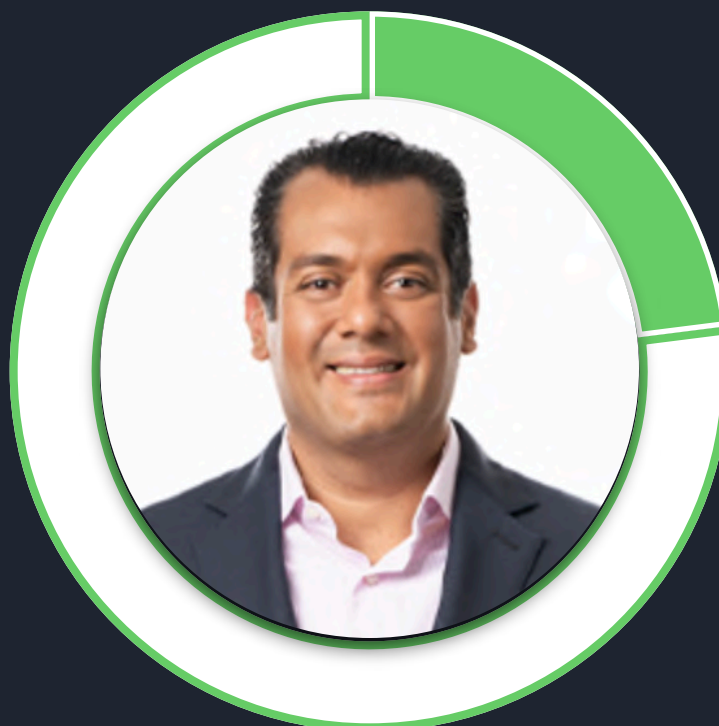
Sergio Gutiérrez Luna